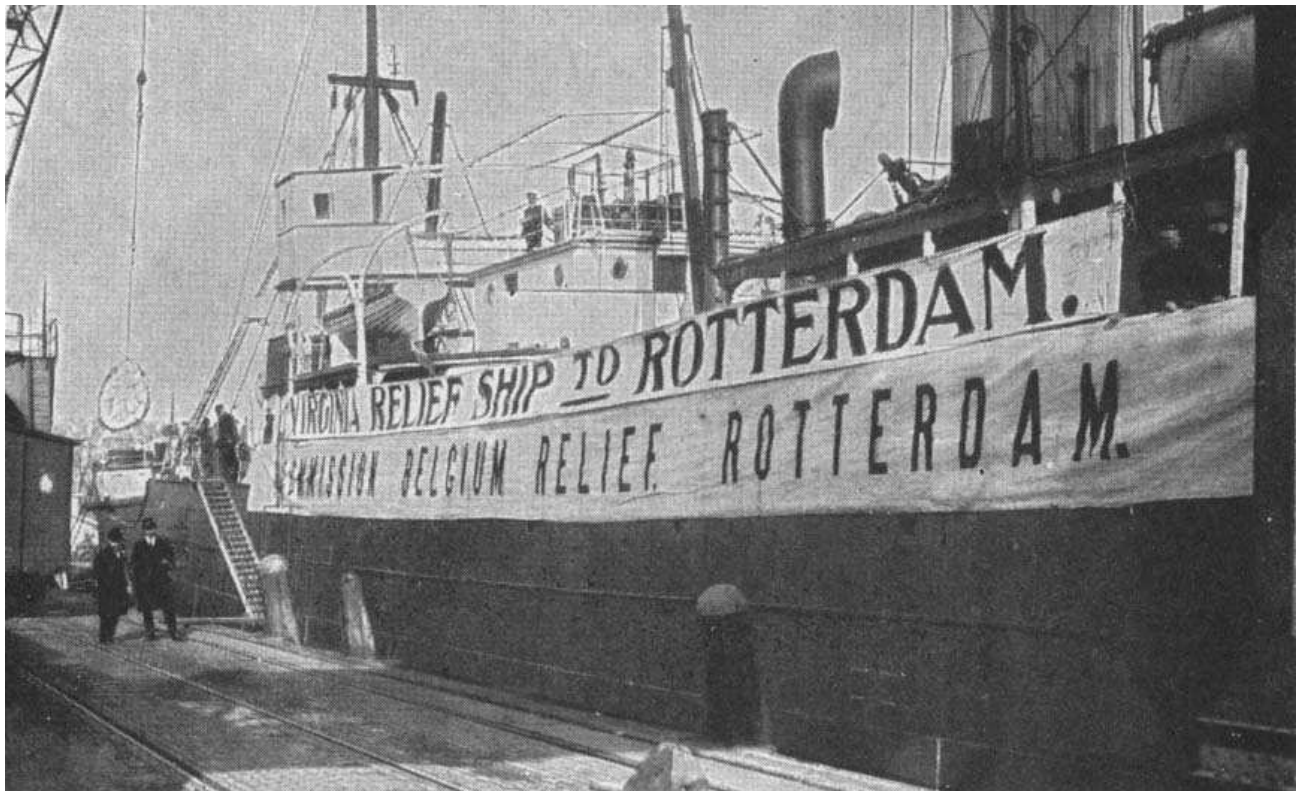
A Belgian relief ship at Rotterdam