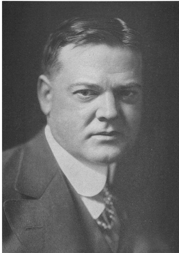
Herbert Clarke Hoover