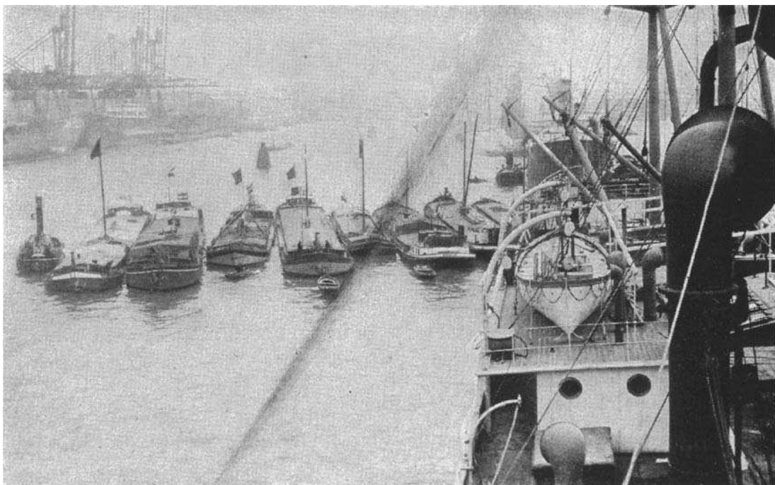
Barges of the Commission for Relief in Belgium leaving Rotterdam with cargoes of food