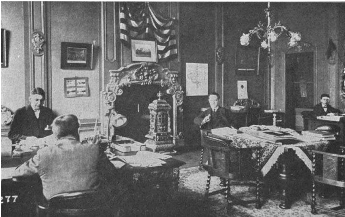
Rotterdam office of the Commission for Relief in Belgium